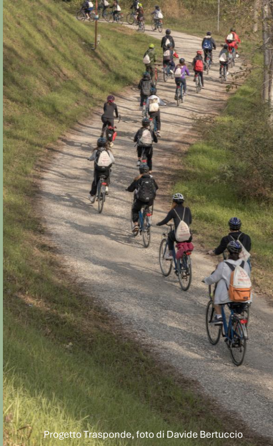
Progetto Trasponde

L'Autorità di Bacino Distrettuale del Fiume Po è il soggetto coordinatore di una governance ampia e partecipata, che mette al centro le amministrazioni comunali, rappresentate nei suoi organi decisionali: l'Assemblea dei Sindaci e la Cabina di Regia.